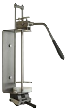
Handdosiergerät „Profi“, zentral

ohne Abschneider 25413 0000 mit Abschneider 25414 0000