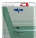
Mipa EP-Härter E 10 kurz