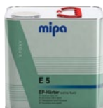
Mipa EP-Härter E 5 extra kurz