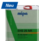
Mipa 2K-HS-Härter EHS 25 NR 2K-Acryl-Härter „normal“ für Mipa 2K-HS-Klarlack.

6 x 0,5 l | 23720 0000 6 x 1 l | 23721 0000S 4 x 2,5 l | 23723 0000