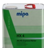
Mipa 2K-HS-Express-Härter HX 4 2K-Acryl-Härter für Mipa 2K-HS-Express-Klarlack CX 4

6 x 1 l | 23751 0000 4 x 5 l | 23755 0000